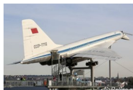
Auto & Technik Museum Sinsheim (D)

Een nadere blik op de Tupolev Tu-144 leert dat er toch wat verschillen zijn. De Tu-144 is groter en sneller, maar hij heeft ook een kleiner bereik door een hoog brandstofverbruik. Een ander belangrijk verschil is dat de Tu-144 kleine vleugeltjes voor op de romp heeft (canards). Die verlagen de landingsnelheid, alhoewel die nog steeds fors hoger is dan die van de Concorde. De TU-144 heeft ook een fors groter landingsgestel met meer wielen dan de Concorde (18 versus 10 wielen). In het Auto & Technik Museum in Sinsheim staan zowel een Concorde als een Tupolev Tu-144 opgesteld en zijn de verschillen tussen beide toestellen goed te zien